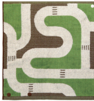
どろろ ミニカーを走らせられる道路柄