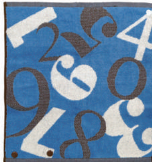
すうじあわせ かくれた数字を探し出そう！