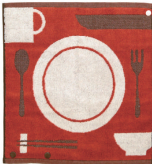
ままごと ままごとあそびに使える！