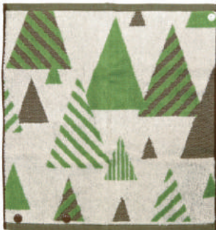
めいろ 木々の間を抜けて進む迷路