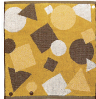
かたちあわせ まる、さんかく、しかくはどれだけあるかな？