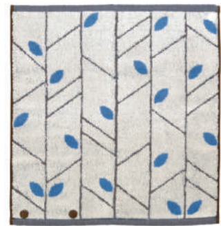
あみだくじ どこに当たるかおたのしみ！