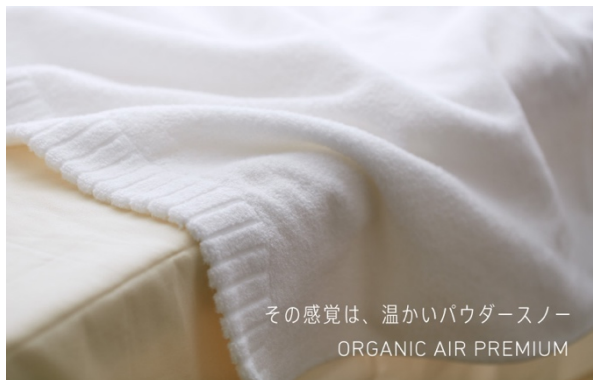
オーガニックエアプレミアム (パウダースノーのような柔らかな風合い)