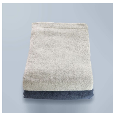
新製品オーガニック 316 (バランスの良いボリューム)