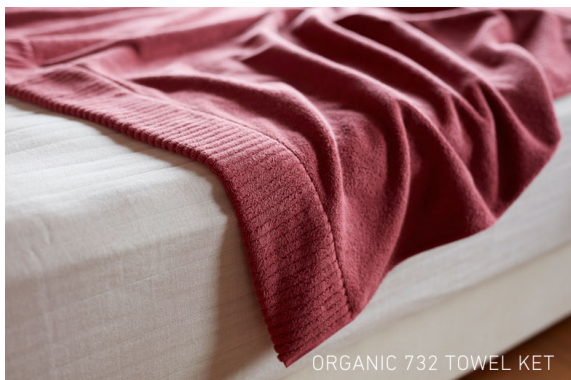
オーガニック 732 (ホテル仕様。しっかりとした肌触り)