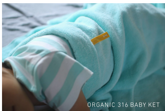
オーガニック 316 ベビーケット (2~4才の子ども用)