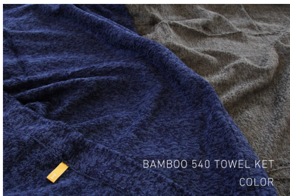
バンブー-540 (バンブーレーヨンを使用したサラサラの風合い)