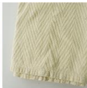
気になる汚れが落ちない