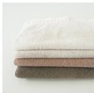
繊維が硬くボリュームがない