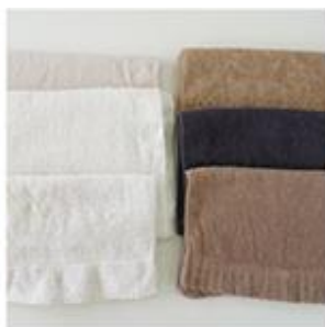
吸水性が落ちている