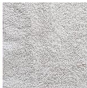
臭いがついている