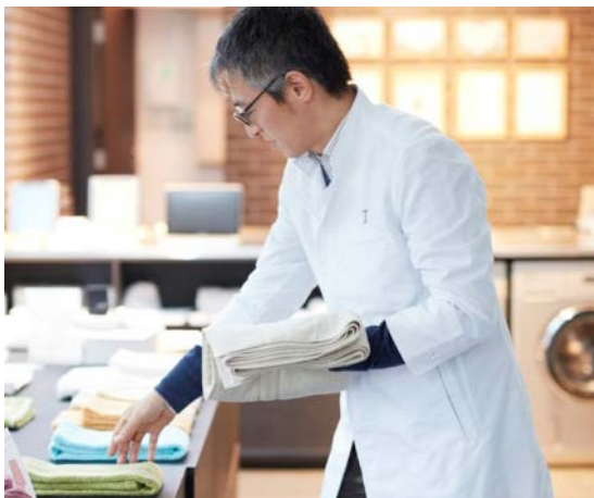
タオルドクターがチェック

IKEUCHI ORGANIC では、タオルドクターが洗濯・乾燥やお手入れをして、お客様のタオルの風合いを限りなく戻します。お客様ご自身で良い状態を保つことができるよう、カルテを作成して何が問題だったか、お客様に正しいメンテナンス方法をお伝えすることで、1年でも長くタオルを使っただけようお客様をサポートします。