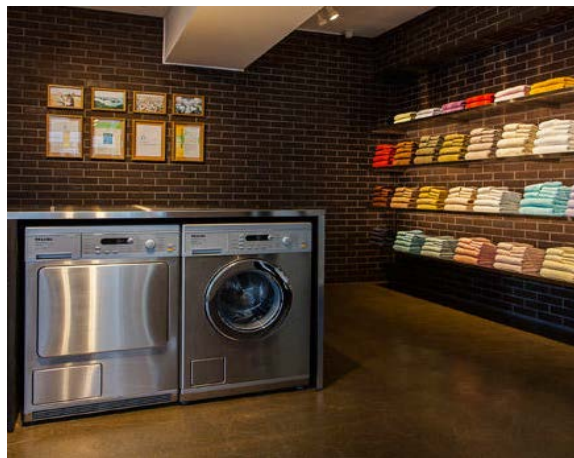
タオルクリニック（直営店）でランドリー

※タオルドクターおよびタオルクリニックはIKEUCHI ORGANIC の登録商標です